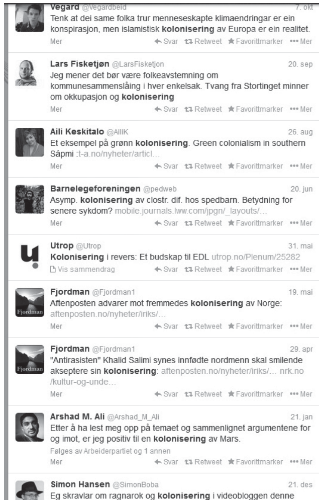
Figur 2. Snipp fra Twitterdiskusjon om «kolonisering».

Eg meiner svaret er nei. Til forskjell frå nettavisene, der lesarar av ei sak om arkeologiske undersøkingar i utgangspunktet ikkje har spesiell interesse eller kunnskap, så treff me ikkje meinigmann på våre eigne plattformer. Me misjonerer til dei som allereie er frelste. Derfor manglar også dei kritiske røystene, dei som utfordrar oss på til dømes pengebruk og tolkingar. Og me veit at dei finst. Løysinga kan vere at me må gå til dei, sidan dei ikkje kjem til oss. Profeten må til fjellet, ikkje omvendt.