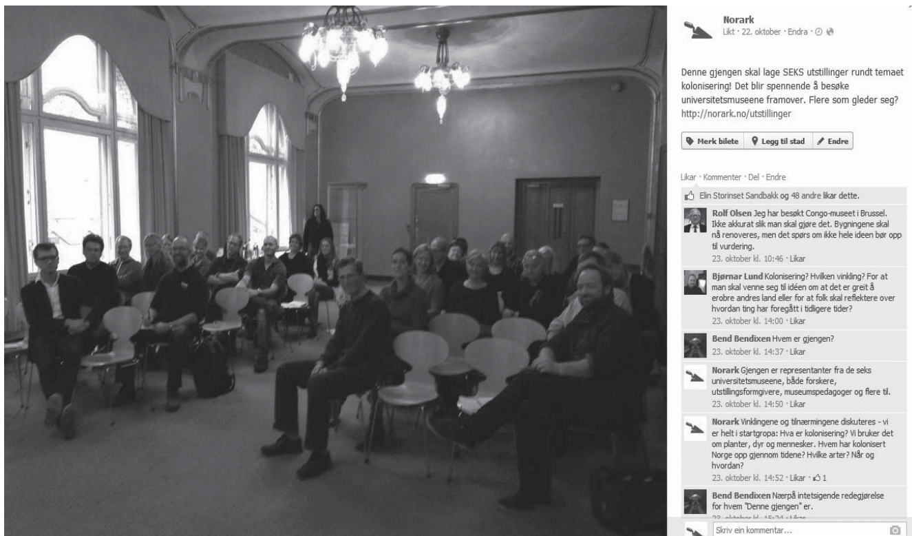
Figur 3. Bilete frå Forsking i felleskaps seminar om «Formidling som kunnskapsgenerende virksomhet» på Facebook skapte diskusjon.

det me museumsfolk som skal bli med der ute, i staden for å tenkje at me skal trekkje folk inn?