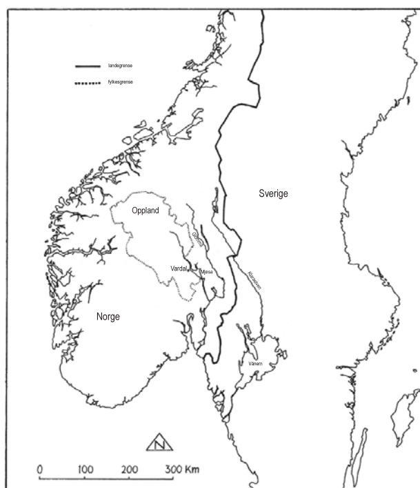
Figur 3 Kart med lokalitetene som beskrives nærmere.

som gjør at disse områdene ikke kan defineres som ueid, i betydningen uten hevdvunne rettigheter for noen (jf. Bergstøl 2008 om sameier i Østerdalen i middelalder og jernalder).