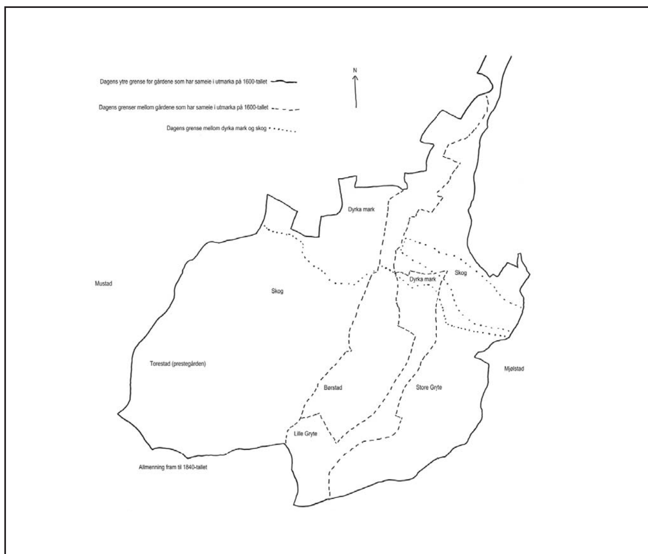
Figur 1. Eiendomsgrensene i området ved gården Gryte.

I de bevarte middelalderlovene er det Magnus Lagabøtes landslov fra 1274 som omtaler sameie i utmark. I tillegg til landsloven er Gulatingsloven for Vestlandet og Frostatingsloven for Midt-Norge bevart. Den lovboke som må ha eksistert for Østlandet er ikke bevart, men en antar at en del av det stoffet som finnes i landsloven,